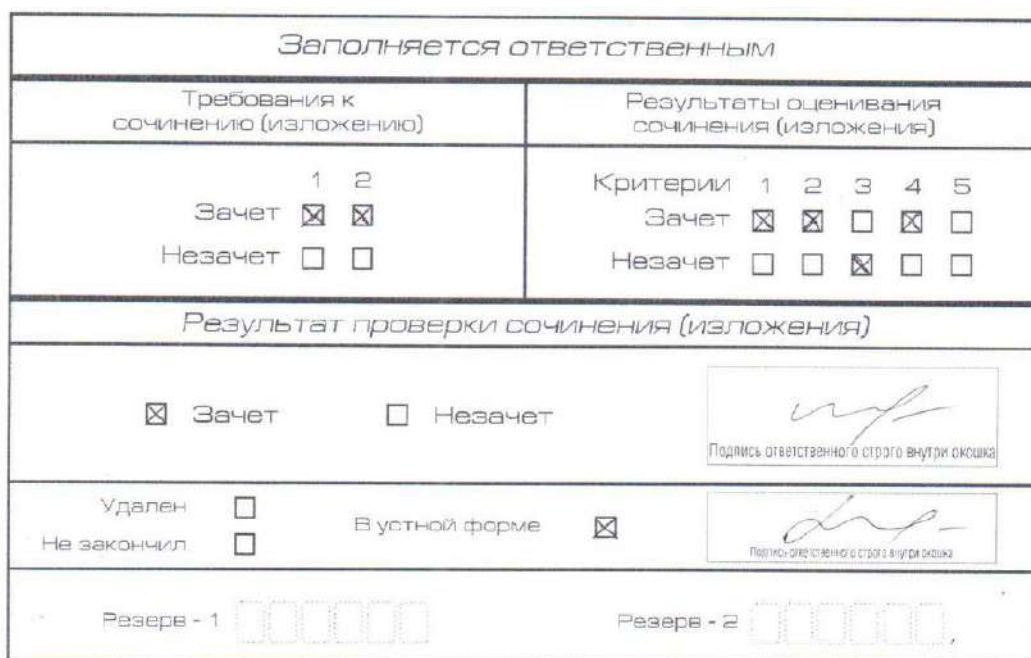
Рис. 9. Область для оценки работы сочинения (изложения) в устной форме

После окончания заполнения бланка регистрации ответственное лицо ставит свою подпись в специально отведенном для этого поле.