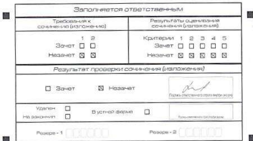
Рис. 1. Область для оценки работы

Если итоговое сочинение (изложение) соответствует требованиям № 1 и № 2, то эксперт комиссии по проверке выставляет «зачет» за выполнение требований № 1 и № 2. Указанные сочинения (изложения) оцениваются по критериям.