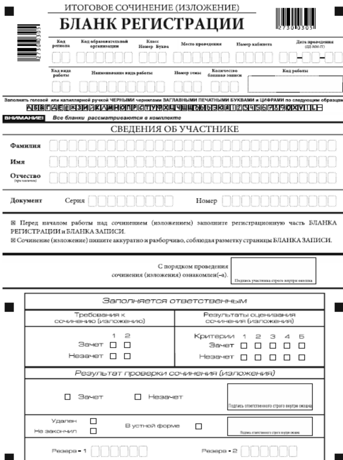
Рис. 1. Бланк регистрации

Бланк регистрации (рис. 1) состоит из трех частей: верхней, средней и нижней.