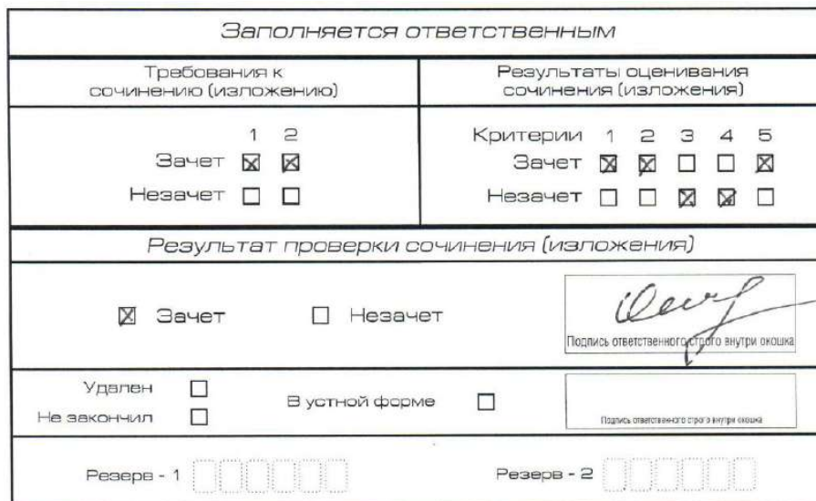
Рис. 2. Область для оценки работы