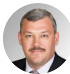
Сергей Гапликов Глава Республики Коми

Мы первыми в России начали выплачивать региональный семейный капитал при рождении первенца. Это 150 тысяч рублей из республиканского бюджета, которые станут хорошей поддержкой для молодых семей.